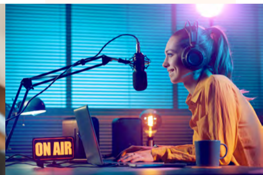
Congress Talks (Podcast)