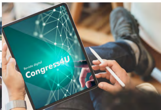
Congress4u (Revista digital)